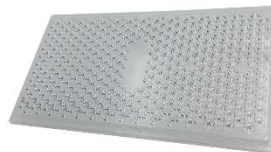
013382 Soczewka 45° do Paxton