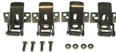
012305 Klips spring panel Malcolm