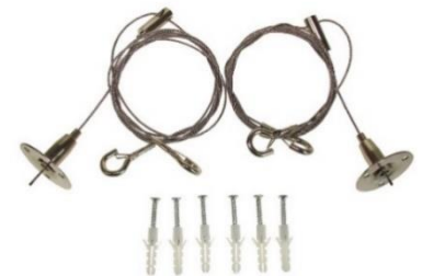
012306 Linki zestaw do panelu Malcolm