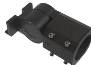
012597 Uchwyt do lampy Jiabin, Labid IV