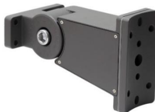
012596 Uchwyt do lampy Jiabin, Labid III