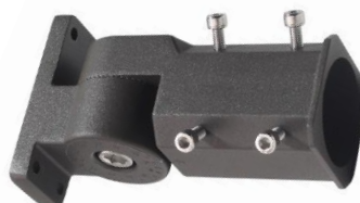
012594 Uchwyt do lampy Jiabin, Labid I