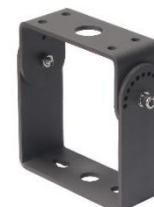
012595 Uchwyt do lampy Jiabin, Labid II