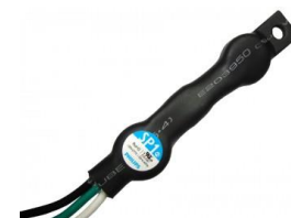
012186 Odgromnik 10kA Philips