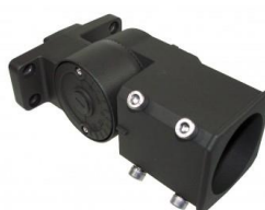
012187 Uchwyt uchylny Short Ø60mm, Kąt regulacji: 180°