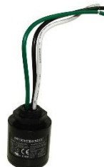
012185 Odgromnik 15kA Inventronics