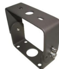
012188 Uchwyt naświetlaczowy Whorl Kąt regulacji: 180°